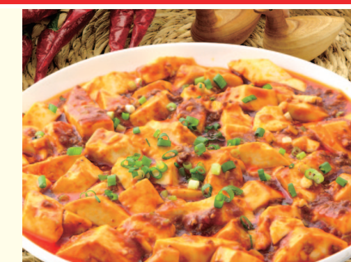
香り豊かな特製麻婆豆腐