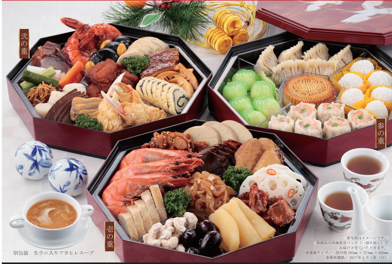
別包装 生ウニ入りフカヒレスープ