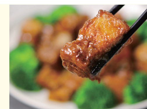
アワビと豚バラの醤油煮込み