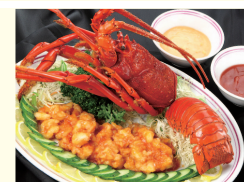
伊勢エビのチリソース

菊華大飯店 〒252-0804 神奈川県藤沢市湘南台 2-5-11 ウエストプラザ 2F